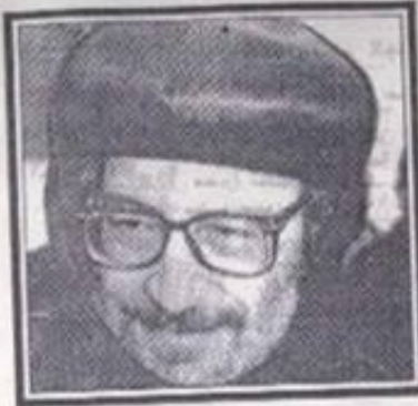
نيافة الحبر الجليل الأنبا بيشوي