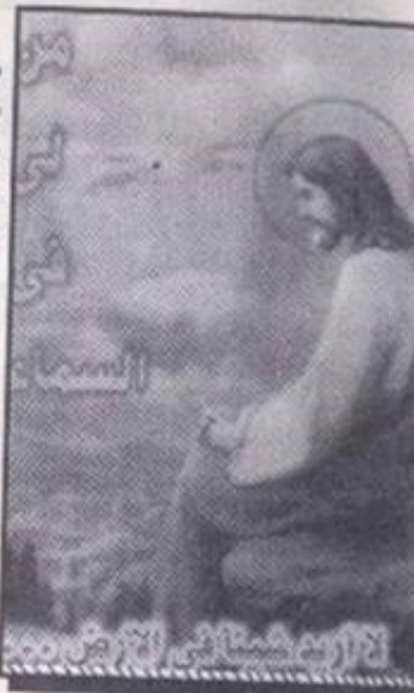
لا إله سِوَاكَ فِي السَّمَاوَاتِ وَالْأَرْضِ وَمِثْلِكَ مَا هُنَا